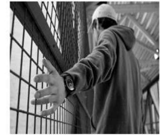
UNGE VOKSNE I KRIMINALOMSORGEN

Les mer her om rapport fra arbeidsgruppe «Tilrettelegging for unge i kriminalomsorgen»